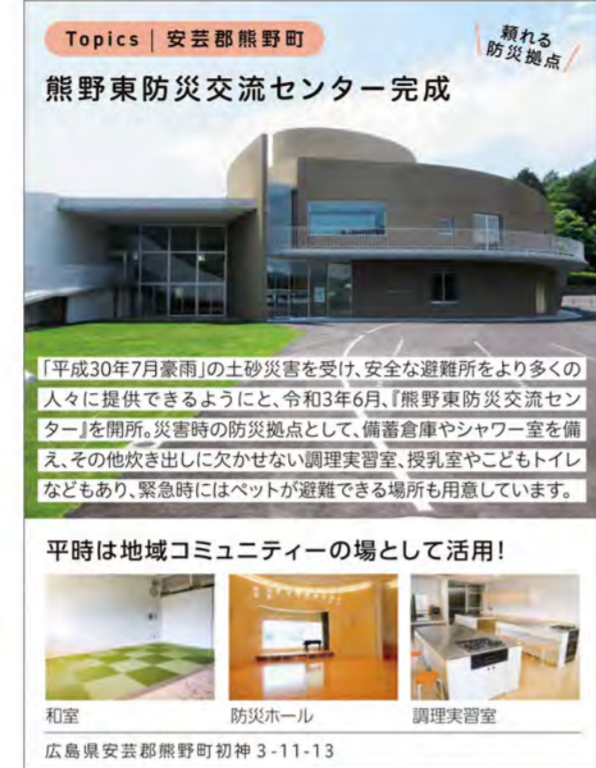
熊野東防災交流センター完成 広島県安芸郡熊野町初神3-11-13

Check 避難所にも2種類あり! 指定緊急避難場所 命を守るため、災害の危険からまずは逃げるための場所。洪水や土砂災害など、災害の種類ごとに異なります。 指定避難所 自宅が被災して帰宅できない場合などに、一定期間、避難生活を送るための施設。 お住まいの自治体または「Yahoo! 防災速報」アプリで確認できますので、チェックしておきましょう。