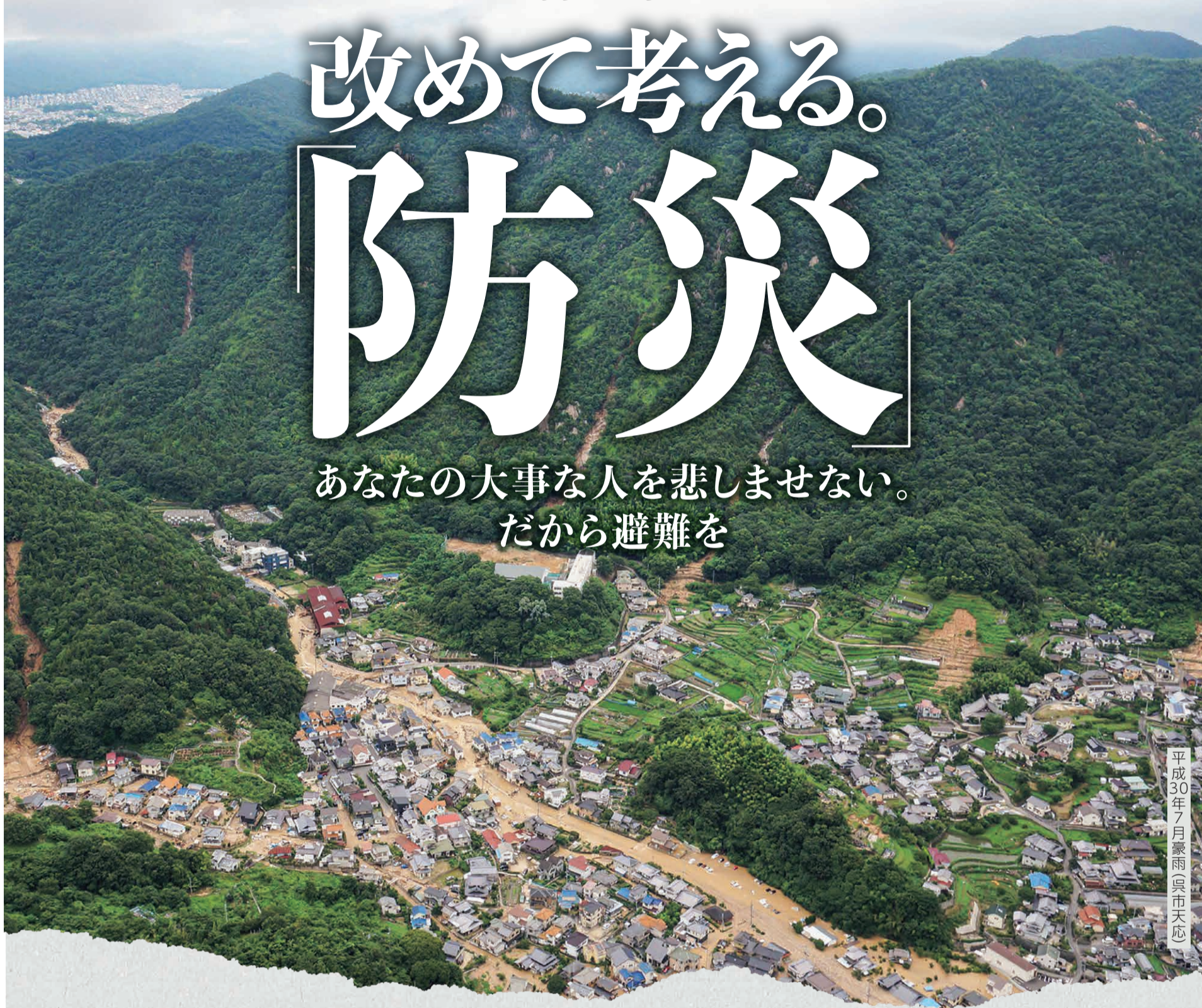
平成30年7月豪雨(呉市天応)