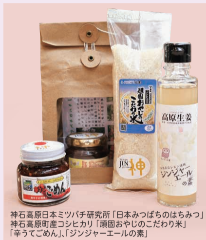
神石高原日本ミツバチ研究所「日本みつばちのはちみつ」 神石高原町産コシヒカリ「頑固おやじのこだわり米」 「辛うてごめん」、「ジンジャーエールの素」

神石高原町の特産物がそろった『道の駅さんわ182ステーション』より、特に優れた特産物に認定される〈JINプレミアム〉認定品をプレゼント。唐辛子を使った佃煮「辛うてごめん」や高原しょうが使用の「ジンジャーエールの素」、地元産のはちみつやコシヒカリをぜひご賞味あれ。