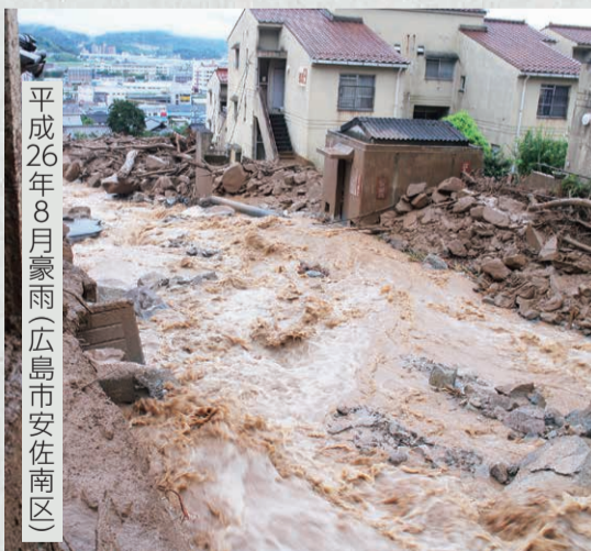
平成26年8月豪雨(広島市安佐南区)