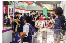
会場の一部を一般公開している様子