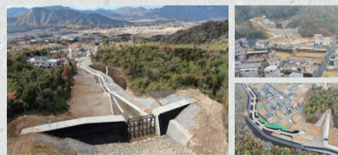
(写真左/東広島市黒瀬町)(写真右上/安芸郡熊野町川角)