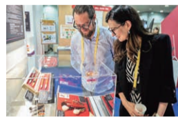
記者が伝統工芸品の展示を見る様子