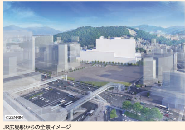
JR広島駅からの全景イメージ

全ての県民が、質の高い医療・介護サービスを受け、住み慣れた地域で安心して暮らし続けることができる…。そんな未来の実現を目指して、広島県では今、「高度医療・人材育成拠点」づくりに取り組んでいます。