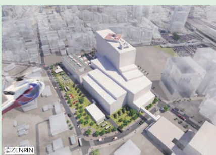
災害時の新病院での医療活動イメージ

A. 新病院では、県立広島病院が担っている基幹災害拠点病院の役割を引き継いで、傷病者の受入れやDMAT*の派遣、人材育成などにより、医療体制を確保し、災害にも強い医療機関を目指します。また、近年、広島でも頻発している水害への対策や大地震への対応を想定した造りとし、災害時の「医療の継続」「応急対応活動の実施」が確保できる病院とします。