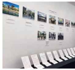
ロンドンでのパネル展

昨年5月に開催されたG7広島サミット。その成果を上げていくため、10月から12月にかけて、広島を中心とした若者をG7各国に派遣し、現地の若者と核兵器廃絶をはじめとする地球規模課題について議論・交流する「若者たちのピース・キャラバン」を実施しました。 また、現地では、核兵器廃絶の必要性について理解を深めていただくため、サミットの写真などを展示したパネル展も開催しました。 参加した日本の若者は、「G7広島サミットで、各国首脳らが、自らの目で平和記念資料館の展示を見て、被爆者の方の証言を聞いたことは、平和に向かって各国の意識を向上させることに大きくつながったと感じた。今回のプロジェクトでは、その良い流れを若者世代から市民レベルに広げ、より良い未来に向け行動していく一歩になると改めて感じ、その一部として貢献できることを大変光栄に思う。今後もこの経験を無駄にせず、実際の行動に移していきたい。」と、決意を新たにしていました。