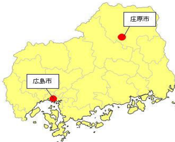
酸性雨の測定（県HPより）

「大気汚染防止法」などの関係法令に基づく固定発生源に対する規制措置の徹底を図るほか、自動車排出ガス等対策の強化を図ることにより、酸性雨の原因となる硫黄酸化物や窒素酸化物の排出抑制を推進するとともに、酸性雨のモニタリング調査を継続して実施します。