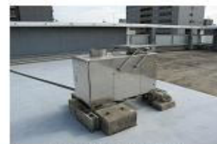
降水自動捕集装置