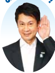
広島県知事 湯崎 英彦