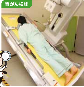
(公財)広島県地域保健医療推進機構 ※イメージ

広島県におけるがんによる死亡者は、全死亡者の約3割。1年間でがんにかかる人の数は約1万9千人にのぼります。にもかかわらず、広島県のがん検診受診率は20~30%程度と低迷。がんが治る確率が飛躍的に高くなる早期発見の機会が十分に活かされていません。