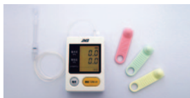
▲医工連携により生まれた製品 (株)ジェイ・エム・エス「JMS舌圧測定器」

広島が誇るものづくり技術を医療・福祉分野に応用・活用し、県内の企業、大学、病院など人材・技術・機関のネットワークを効果的に活かしながら、医療・福祉機器関連産業の集積、拡大をめざします。