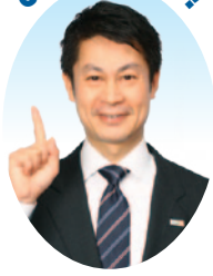
広島県知事 湯崎 英彦

首都圏での販路開拓は、消費者ニーズを把握することが重要です。広島県では、東京・銀座にある広島ブランドショップT・A・Uの店舗内に、1か月のテスト販売コーナーを設け、県内事業者の皆様がチャレンジしていただき、お客様や専門家の意見をフィードバックする取組を行っています。また、首都圏のバイヤー(仕入担当者等)との商談会なども行っており、昨年度は、T・A・Uへの出品を契機として、首都圏で新しく開拓できた販路が49件ありました。今後もT・A・Uの事例を分析して売れる商品づくりを学ぶセミナーを実施するなど、県内事業者の皆様向けの取組を進めてまいります。意欲のある県内事業者のビジネスチャンスを創出し、首都圏等での販路開拓につなげていくことは、T・A・Uに求められている重要な目的の一つです。ぜひこの機会を「活用」ください。