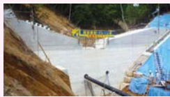
砂防事業(安佐北区可部町桐原)