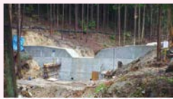
治山事業(安佐北区可部町上原)