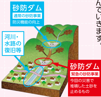
復旧事業のイメージ