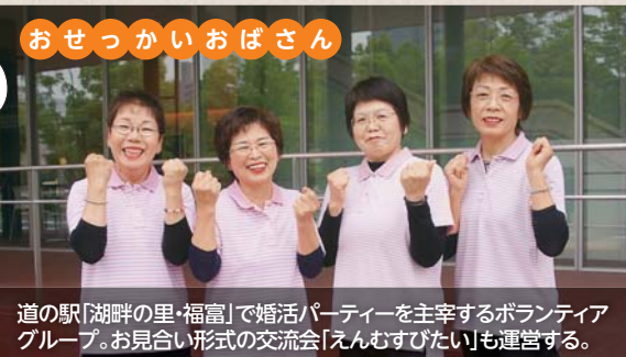
おせっかいおばさん

道の駅「湖畔の里・福富」で婚活パーティーを主宰するボランティアグループ。お見合い形式の交流会「えんむすびたい」も運営する。