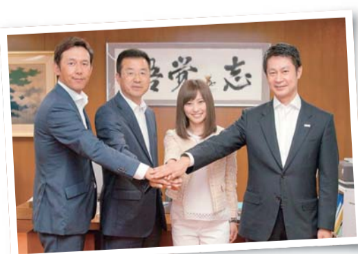
この動画やごぼれ話は 県ホームページでも配信中国!! ひろしま県民だより 検索