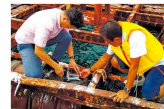
イカダの上にセンサーを設置

牡蠣生産量全国1位を誇る広島県。その牡蠣養殖で欠かせないのが牡蠣の幼生を貝殻に付着させる「採苗」です。しかし近年は、採苗率の低下やばらつきが目立ち、産業全体の存続に影響を及ぼしかねない状況となっています。そこでドローンやセンサーを使って海洋情報を収集し、AIや機械学習による分析を行い、生産量の増加と生産効率を上げる実証実験に取り組んでいます。