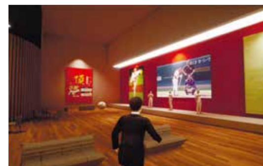
アバターでバーチャル空間に入り、ファン交流とイベントなどを体験

コロナ禍による入場制限などで、なかなかスポーツ観戦に行けない中、スポーツパーをイメージしたバーチャル空間での応援を実現。皆さんのアバター(分身)が、「バーチャルワールド広島」に集まって一緒に応援したり、イベントなど様々なコンテンツをバーチャルで視聴・体験できる新たな応援スタイルをつくらうと取り組んでいます。