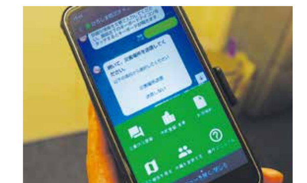
LINE公式アカウント「ひろしま防災チャットボット」で被害情報収集

近年増加する災害。平成30年7月豪雨災害の時には、全体像の把握や情報共有に時間がかかったことが課題となりました。そこでLINE公式アカウント「ひろしま防災チャットボット」で被害情報を収集。AIが情報を分析し地図上で集約を行うことで、迅速に災害の全体像を把握する仕組みの整備を行っています。この取り組みにより、最適な避難情報の発令や迅速な救助活動に役立っています。