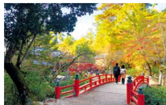
ストレスなく観光できるようにデジタルがサポート

宮島では近年の観光客増加により、島内の混雑や宮島口の渋滞などの待ち時間による“ストレス”が生じていました。そこで、カメラやセンサー、AI分析により、駐車場やトイレの混雑状況が見える化。コロナ禍では“密”を回避するために役に立てられるなど、より安心して楽しめるツールとして活用されていました。