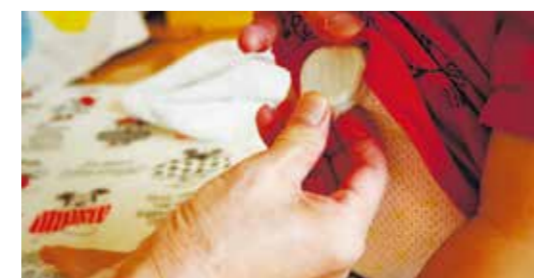
呼吸や体の向きを感知するセンサーを肌着に取り付け

保育の現場では、お昼寝の時間に乳幼児一人一人の呼吸状態や体の向きを記録するという大変な業務があります。そこで、着衣に付けたセンサーで呼吸状態やうつ伏せになっていないかを見守り。専用タブレットで状況を自動記録し、非常時にはアラームが鳴る仕組みを実証中です。保育士の負担は減り、保護者にとってはより安心して質の高い保育サービスの提供が期待できます。