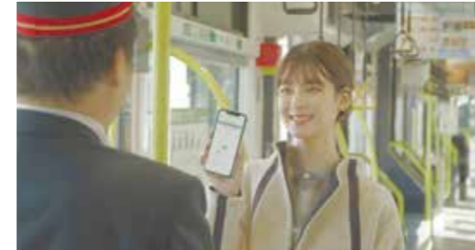
定額デジタルチケットで様々な乗り物を自由に利用

※MaaS(マース):「Mobility as a Service」の略。出発地から目的地までのあらゆる交通手段を、検索や予約、決済まで含めた一つのサービスとして利用者に提供する考え方。