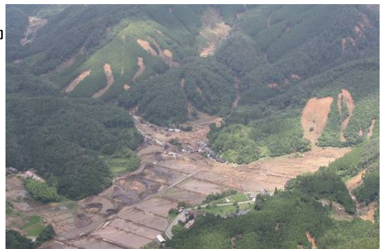
H22.7 庄原市の集中豪雨による被災状況