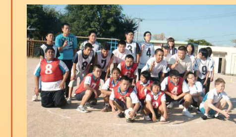
シンガポールの生徒たちと記念の1枚

庄原特別支援学校は、7月4日・5日にシンガポールの特別支援学校(2校)と姉妹校提携を締結しました。9月25日・26日の2日間には、シンガポールから生徒と先生たちが庄原特別支援学校を初めて訪問し、さまざまな交流が行われました。初日の歓迎会では、庄原特別支援学校の生徒・教職員が歓迎の演奏・ダンスを行い、シンガポールの生徒からはダンスの披露がありました。田楽太鼓の実演や体験では大いに盛り上がり、和やかな雰囲気会の会となりました。その後は一緒に作業学習の授業に参加したり、備北丘陵公園でレクリエーション活動をしたり、運動部の活動に参加したりと、有意義で充実した2日間となりました。今後はインターネットを活用し、音声や映像によってリアルタイムでお互いがコミュニケーションを行うなど、継続的な交流を予定しています。