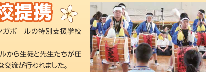
田楽太鼓による歓迎の様子