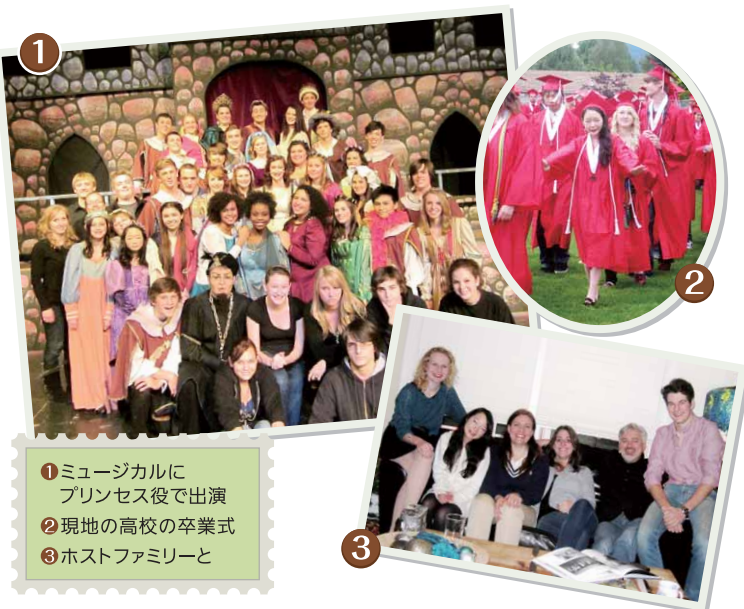
① ミュージカルにプリンセス役で出演 ② 現地の高校の卒業式 ③ ホストファミリーと