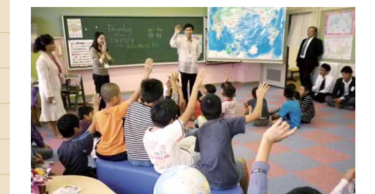
E-スクエア(高美が丘小学校)

10月1日、東広島市の高美が丘小学校と中黒瀬小学校に、異文化交流体験空間「E-スクエア」が開設されました。「E」は小学校(Elementary school)におけるやさしい(Easy)、楽しい(Enjoyable)、体験(Experience)という意味を持ち、外国人スタッフと日本人コーディネーターが連携して、子どもたちが外国の遊びや文化などに直接触れる機会を提供します。昼休憩や放課後に活動が行われています。