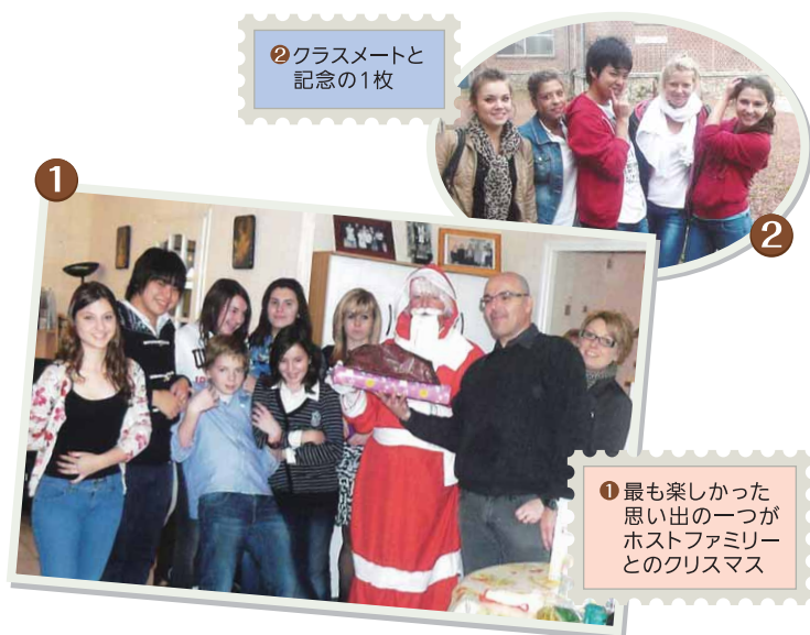
① クラスメートと記念の1枚 ② 最も楽しかった思い出の一つがホストファミリーとのクリスマス ③ 語学力はもちろんですが、日本では決して経験できない苦労を乗り越え、身に付けた自信を大事にしてほしいと思います。これからもっと器の大きな人になってほしいです。彼ららしくと飛躍できると確信しています。

もともと英語が好きだったので、将来は語学力を生かした仕事に就きたいと思い、留学を決めました。フランスを選んだのは、せっかく留学するのなら新たな言語に挑戦したいと思ったからです。当初は「ボンジュール(こんにちは)」と「メルシー(ありがとう)」しか知らなかったのですが、言葉には本当に苦労しました。最初の1か月ほどは、言葉の問題から自分の殻に閉じこもってしまい、ホストファミリーとぎくしゃくすることもありました。でも言葉が分からないなりに、人の輪に入り、フランスの生活を楽しむ努力をしようとすると、ホストファミリーともクラスメートとも、少しずつ気持ちを通じ合うようになりました。日本ではあまり表に出せなかった「ダメな自分」と向き合うことができたことも、自分自身を大きく成長させてくれたと思います。グローバル社会において、自分が自分らしくいることはとても大切です。ありのままの自分を好きになることができると初めて、多様な価値観や文化を認められるのだと思います。今後はフランスの大学へ進学を目指します。