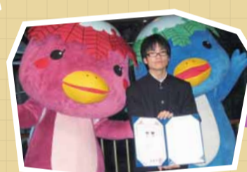
生徒考案のマスコットキャラクター「心美ちゃん」と「体健くん」が完成。 河内高等学校