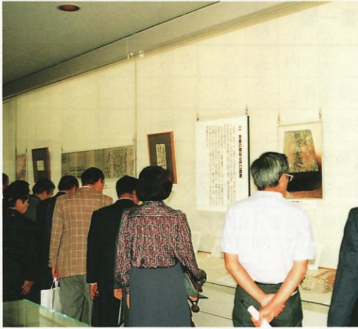
収蔵文書展の風景