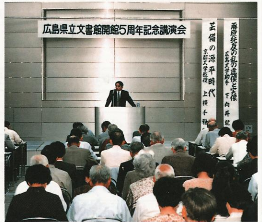
開館5周年記念講演会の風景