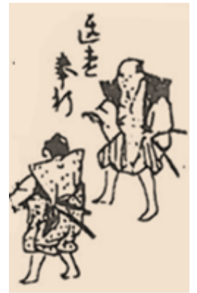
ちそく ぶぎょう 遅速奉行