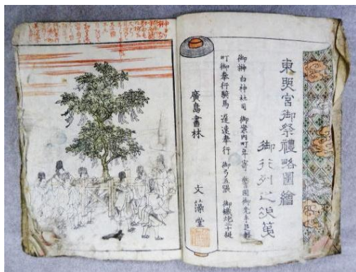
「東照宮御祭礼略図繪」文化 12 年 (1815)