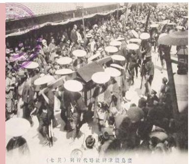
(七共) 行列代非社前津鏡島書