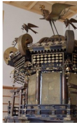
にひゃっかん みこし 二百貫神輿