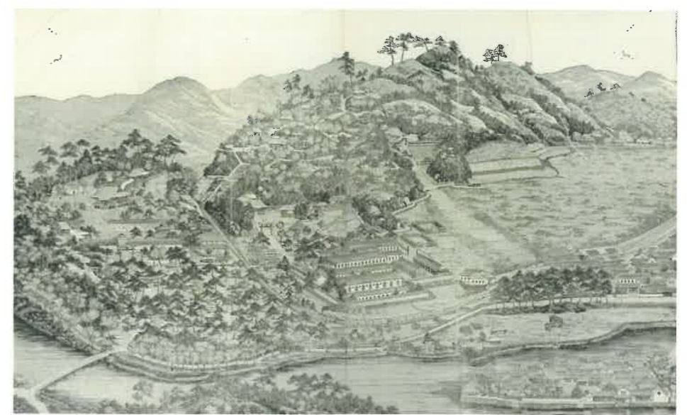
広島市鉄道開通之図（明治27年6月10日芸備日日新聞付録） 200407-2687 右端に見えるのが広島駅。中央の建物は騎兵隊當所。中央やや右上に東照宮、左端に饒津神社が描かれている。