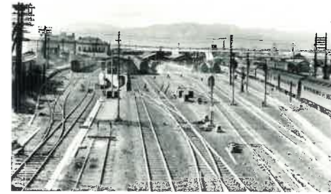
広島駅構内 昭和36年9月23日 200407-3014 左側に、今は無い宇品線のホームが見える。