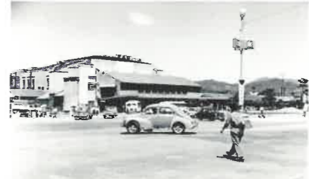
広島駅(昭和36年6月18日) 200407-5551 駅舎正面に張り出して出札室が新設された(昭和24年7月7日完成)。