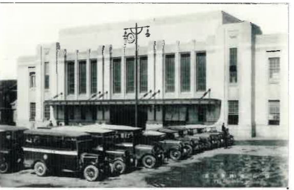
昭和戦前期の広島駅 手前は広島乗合自動車(株)のボンネット車両 200407-3114