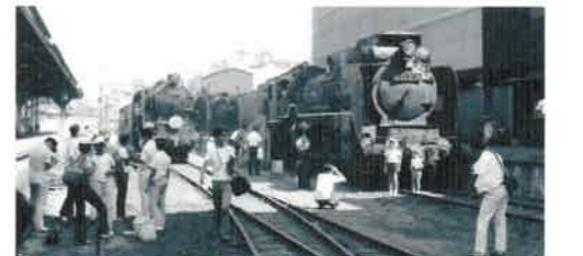
世紀の蒸気機関車展 広島駅展示会場(0番線)(昭和47年8月5日) 200407-5551