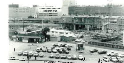
工事中の山陽新幹線広島駅(昭和48年1月27日) 駅北側から南方を望む。下に平屋建ての北口駅舎が見える。 200407-3575