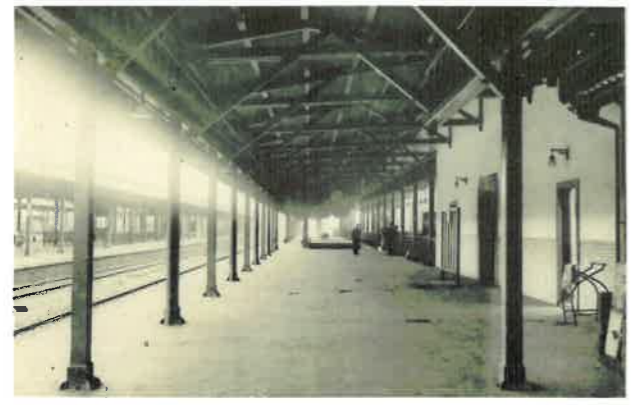
広島駅 本屋側の乗降場 200407-2347