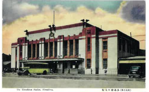
昭和戦前期の広島駅 外観の塗装に変化が見える 200407-3114