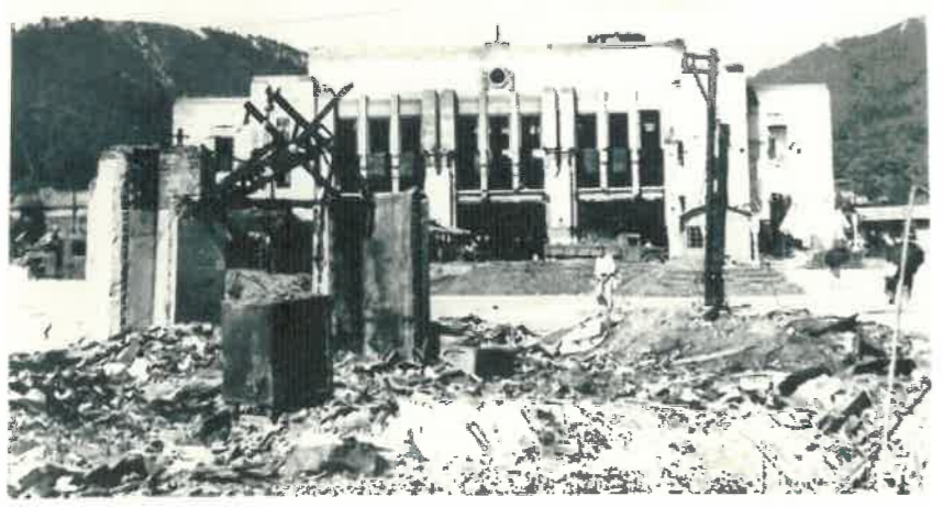
被爆後の広島駅（昭和20年10月頃）

燃え広がった火災は、駅の東西両方から本館を襲い、消防団の必死の消火もむなしく、鉄筋コンクリートの本館も焼かれました。後日、倒壊した待合室の跡から七八人の焼死者が発見され、その中には陸軍幼年学校の生徒約二〇名も含まれていました。また、広島駅の職員も一一名が亡くなり、重軽傷者を含めて二二二名が被災しました。負傷者の中には、後に原爆後遺症で亡くなる人もいました。