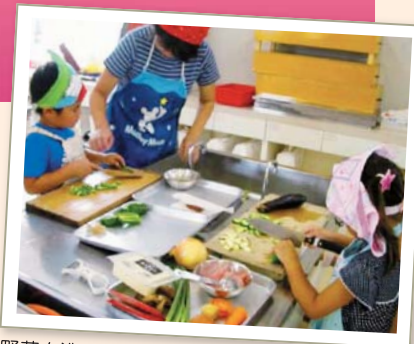
野菜を洗う、種をとるなどの下ごしらえで、野菜の形も知ることができました。

大野東小学校では、昨年「夏休み親子料理教室『親子でつくろう! 元気ごはん』」を開催。子どもと大人と一緒に、給食メニューを「作る」ところから「片付ける」ところまで挑戦し、料理の楽しさや、野菜を食べる大切さを学びました。