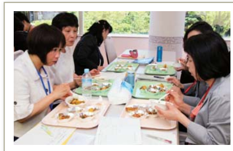
6月12日に実施した試食会の様子