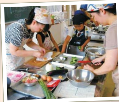
「これどうするの」「次は何しようか」など、調理を通して子どもと大人のコミュニケーションがはずみました。