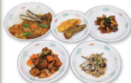
「ひろしま給食メニュー」の候補