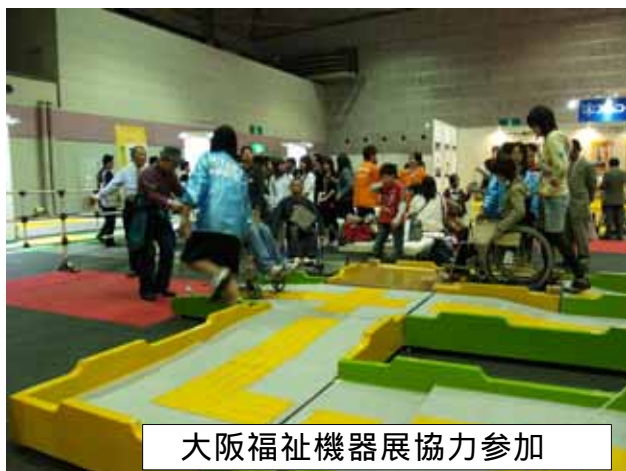
大阪福祉機器展協力参加

障害者や高齢者にとって段差や階段、道路のごぼこなど外出時におけるバリアが多く見かけられる。目に見えるバリアを取り除くのを待つのは不可能です。私達も皆さんと同じように出かけたくなります。 私達当事者だからわかるバリアを集約したこの体験ユニットは、「何が大変なのか」、「どうやって乗り越えるのか」を知っていただきたいと同時に、介助することの必要性を考えて欲しいと思っています。 少しのサポートがあれば私達もどこにも行くことができるということを知ってください。 一人できないことの多い私達ですが一人の市民として生活を送れるように望んでいます。 体験することによって、どんなサポートが必要なのか理解できれば、いつでも、どこでも手を差し伸べることでできる優しい町につながると思うのです。