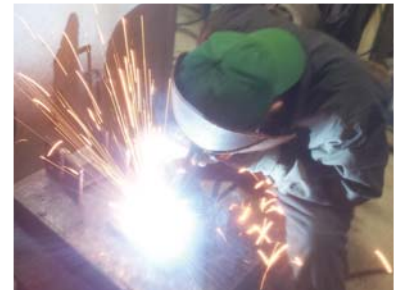
創造性豊かで、ものづくり技術を身に付けた、たくましい工業技術者を育成しています。

就職活動に幅を持たせるため、国家技能検定普通旋盤作業や溶接評価者試験、電気工事士、電気主任技術者等の資格取得に挑戦しています。