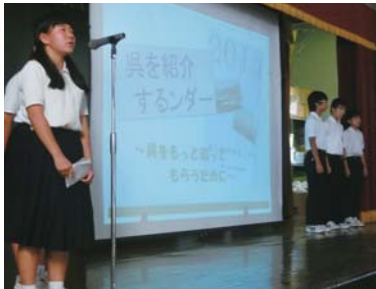
総合的な学習の時間等で、郷土を愛する心などを育成しています。(平成25年度広島県教育奨励賞を受賞)

よりよい学校、よりよい街づくりに貢献していくために、先輩から受け継いだ「両中しぐさ」を伝統として守っていきます。