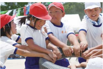
道徳教育を学校教育の中心に据えた研究を進めています。(平成25年度広島県教育奨励賞を受賞)

「笑顔いっぱい! きらりを感じ合い、きらりと輝こう!」をテーマに、よりよい自分を目指して頑張っています。