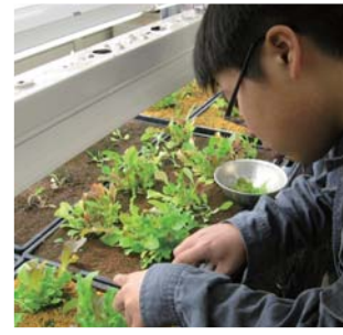
水稲用の育苗箱を水に浮かべて葉野菜等を育てる「浮き菜(うきらく)栽培法」を導入しました。