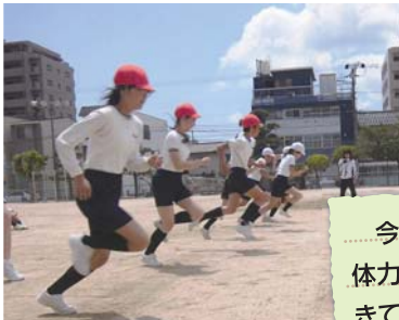
平成25年度子供の体力向上関係表彰 体力づくり優秀賞を受賞

今まで目標を決めて体力づくりに取り組んできてよかった。中学校に入学したら陸上クラブに入りがんばりたい。