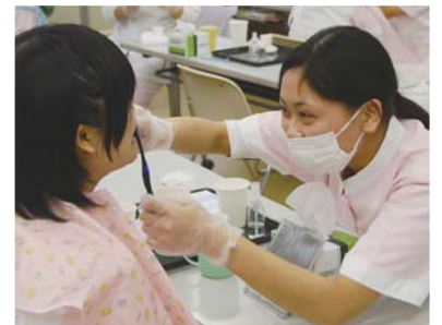
介護実習での「口腔ケア」の様子。口腔内を清潔にし、口腔機能を維持・向上していきます。

将来の夢は高齢者の生活を支える介護福祉士になること。そのために福祉について学び、実習に取り組んでいます。