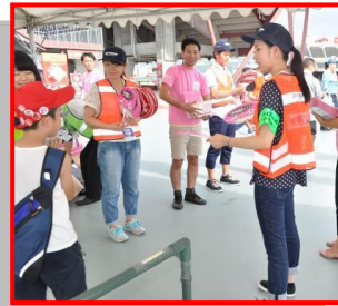
学生ボランティアも大活躍してくれました！