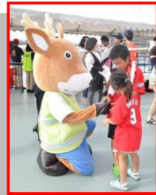
モシカもお手伝い