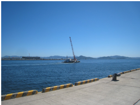
11:00 広島港廿日市地区で資材を積み込み宮島口へ向け出航

平成 25 年 9 月 17 日 澄みきった秋晴のもと、宮島口埋立工事に着手しました。 工事は、工事に伴う濁りが施工区域外へ及ぼす影響を抑えるための、汚濁防止膜の設置から開始しました。 フェリー航路に近接しての工事のため、細心の注意を払い工事を施工しています。