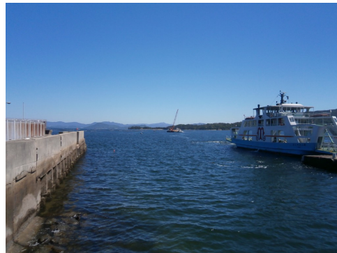
12:30 作業船が宮島口に入港