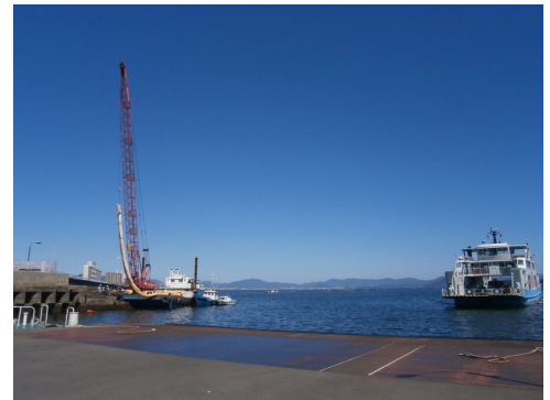
13:30 汚濁防止膜設置開始