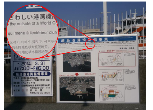
工事説明看板（5カ国語）