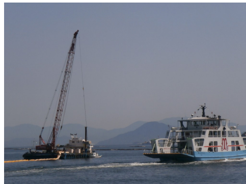
工事箇所近くを航行するフェリー