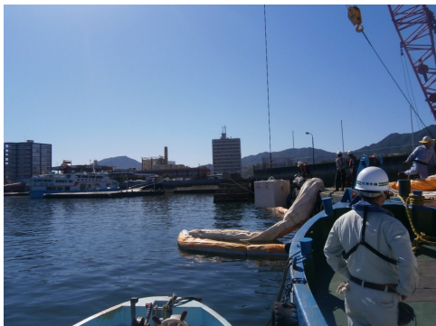
14:00 アンカーブロック設置