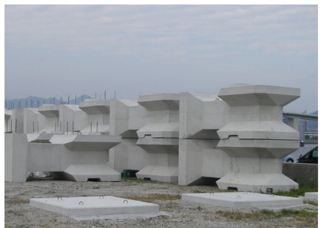
据付を待つケーソン（左）と直立消波ブロック（右）