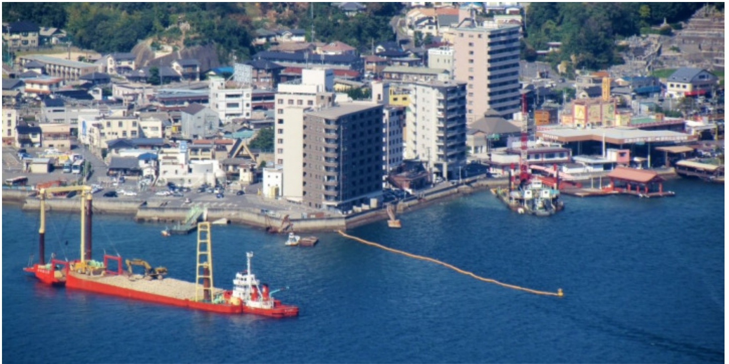
捨石投入状況（沖に停泊した運搬船から、作業船に積替えて捨石投入作業を行いました。）