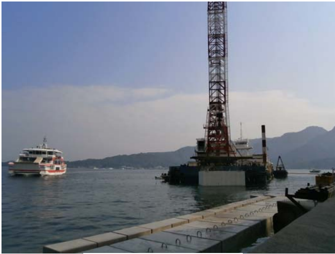
方塊ブロック（手前）

平成 25 年 11 月 5 日～6 日、400 t 吊の起重機船で方塊ブロック及び橋台部ケーソンの据付を行いました。