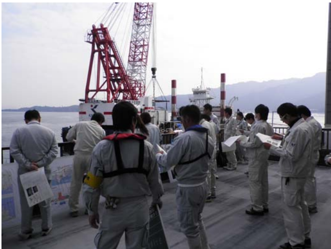
ケーソン据付に合わせて研修会を開催しました