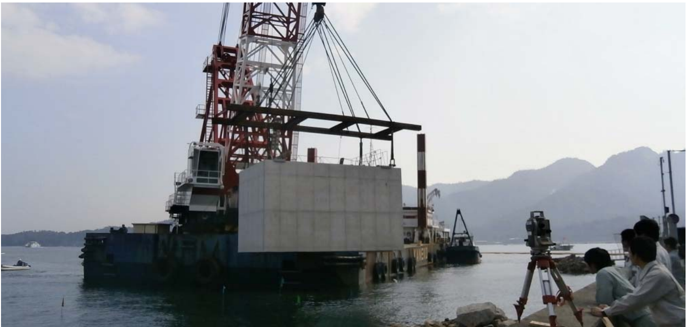
橋台部ケーソン据付状況