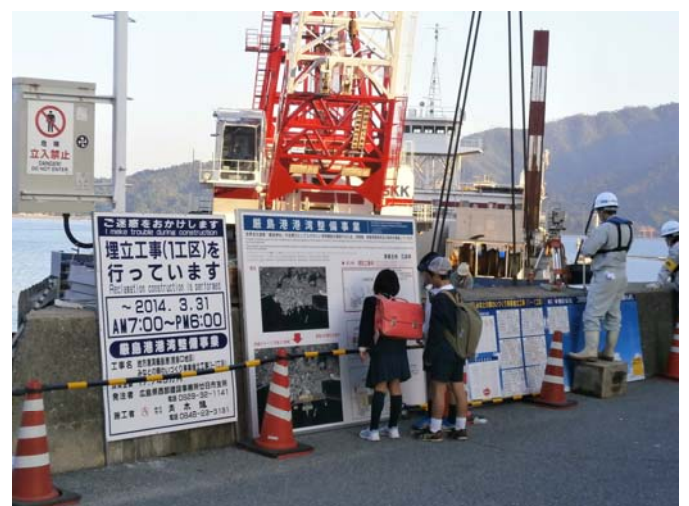
工事説明看板の説明を読む小学生