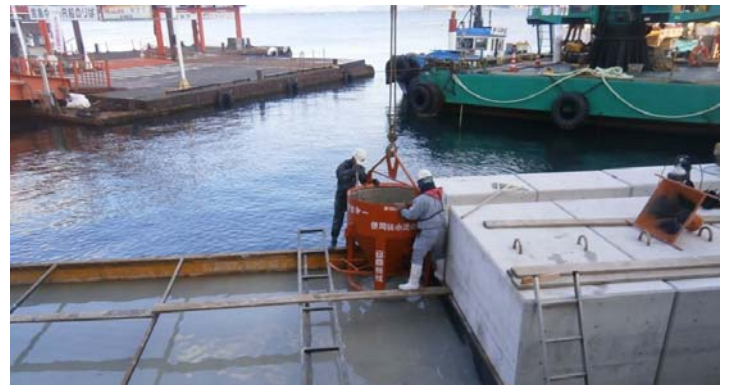
現場打ちコンクリート打設