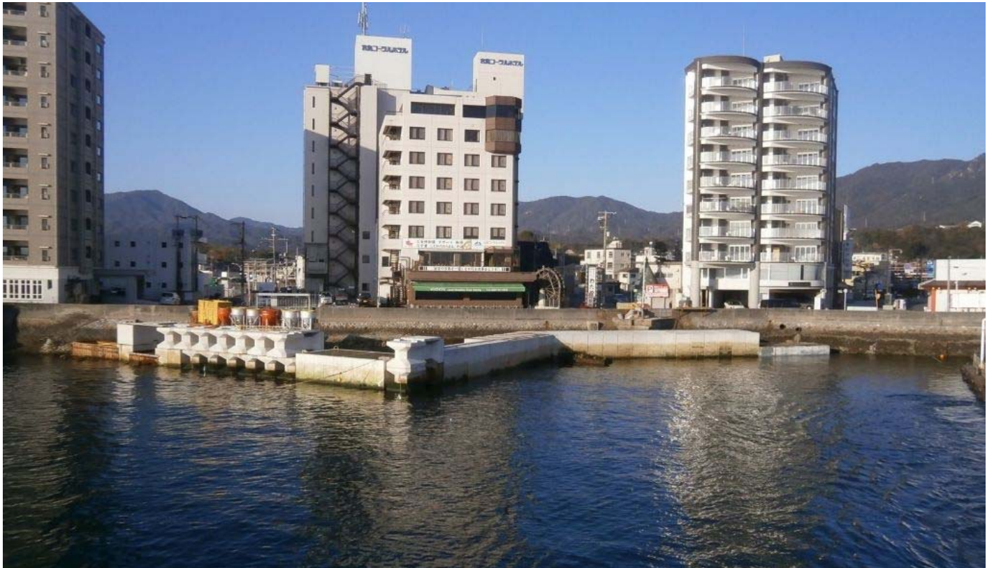
1工区全景（JRフェリーより）