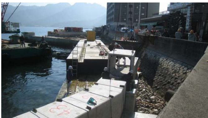
排水ボックス据付