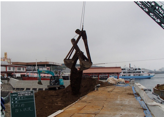
埋立土投入状況(建設発生土)