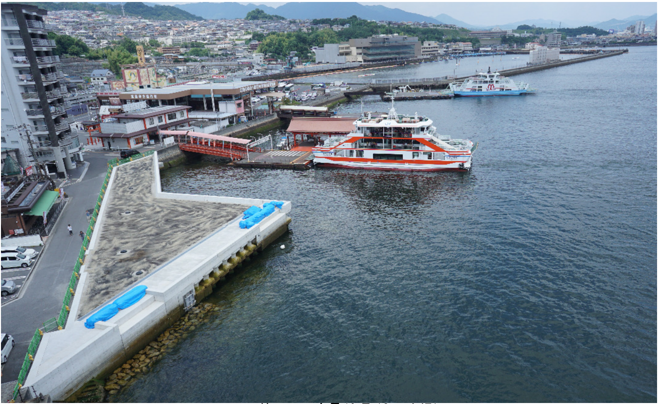
第1工区全景(6月13日空撮)