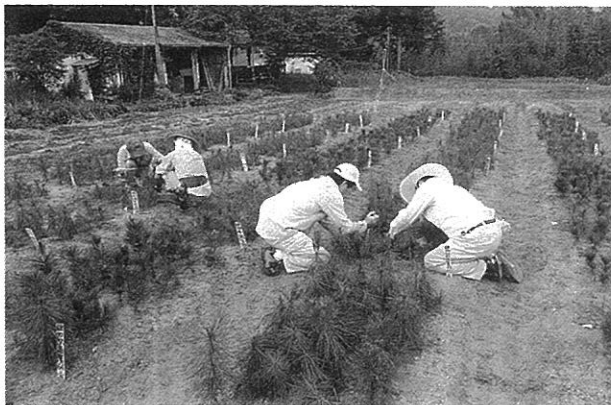
抵抗性マツの接種検定