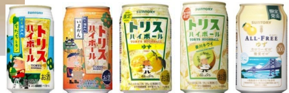
(サントリー酒類株式会社) オールフリー瀬戸内ゆず 等