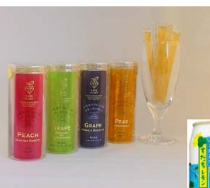
(株式会社果実工房) スティックシャーベット フルーツコラーゲンゼリー