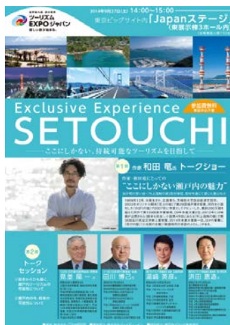
②【ツーリズム EXPO (東京)】