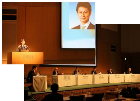
②【瀬戸内7県観光リレーフォーラム (兵庫)】