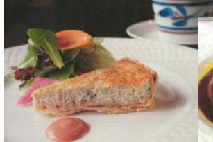
前菜「峠下牛の挽肉入りキッシュタルト」