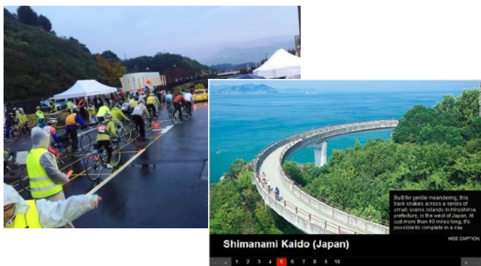
⑨【CNN サイト (広島・愛媛)】