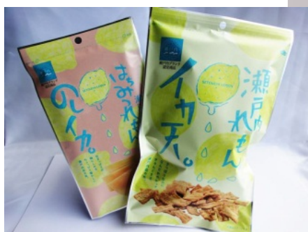
(まるか食品) イカ天 瀬戸内レモン味のしイカ はちみつレモン味