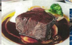
メインディッシュ「峠下牛ほほ肉の日本酒と赤ワイン煮込み」