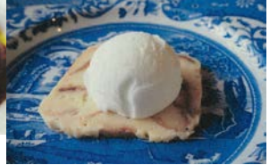
デザート「大吟醸の酒粕を使ったパンプディング牛乳のアイスクリーム添え」