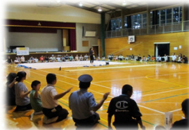
(中学校区の地区懇談会)