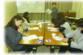
(公民館での家庭教育講座)