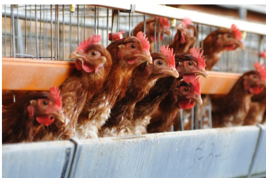
鶏舎内の純国産鶏もみじ