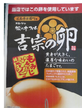
飲食店様用POP(もみじたまご)