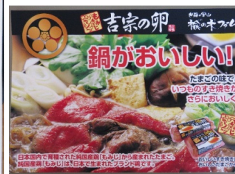
飲食店様用POP, 季節POP(冬Ver)