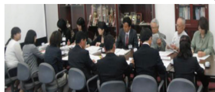
学校・家庭・地域社会の連携による道徳教育に関する「地域推進協議会」 (府中市立上下中学校区)