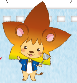
「2016ひろしま総文」 大会マスコットキャラクター もみおん

10年先の社会を見すえた新しい教育 広島版「学びの変革」アクション・プラン がはじまりました。