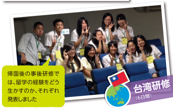
帰国後の事後研修では、留学の経験をどう生かすのか、それぞれ発表しました