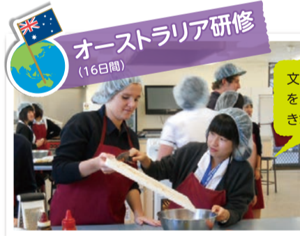
オーストラリア研修 (16日間)