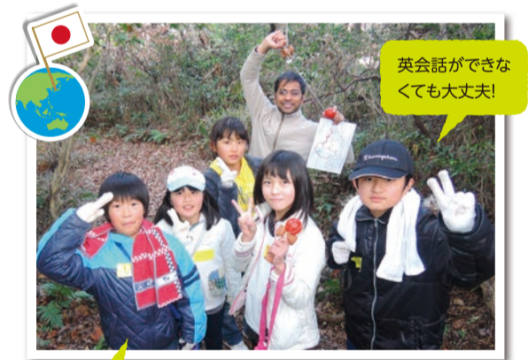
英会話ができなくても大丈夫!