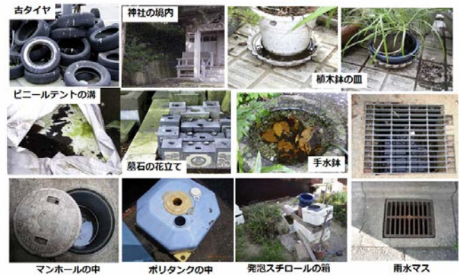
図1. ヒトスジシマカ幼虫の生息場所