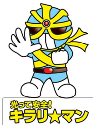
反射材活用促進キャラクター(広島県警)

この運動の実施結果を、 平成27年10月9日(金) までに広島県交通対策協議会交通安全対策部会事務局(交通安全対策室)へ提出すること。(報告様式については、別途送付する。)