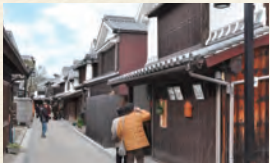
(例) 乙女座に行ったら、御手洗の町も散歩してみよう。

ガイドに載っている建物だけでなく、周辺を歩いて名物料理を食べたりして、その建物がある地域を感じてみましょう。