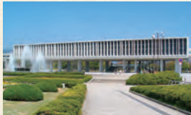
(例) 平和記念資料館の形には深い意味が込められています。

建物の形はバラエティ豊か。「なぜこんな形なのかな?」と推理してみると楽しいですよ。