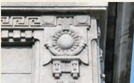
(例) 旧マルヤマ商店事務所の外壁装飾。とても丁寧な仕事ぶりです。

柱頭飾りや彫り物などをじっくり観察してみましょう。当時の職人たちの腕前にびっくりすることもあるかも!?