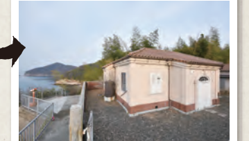
同じ建物でも、撮り方によって「どのような立地で歴史を刻んできたのか」「どのような人が利用する建物なのか」など観る人に想像させる幅が生まれる。