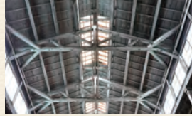
(例) ヤマトロックマシン東城工場の屋根裏は、美しいトラス構造です。

和風建築は太い梁が特徴で、洋館はトラスと呼ばれる三角形の構造が特徴。和風でも劇場や学校などはトラスを使うことも。