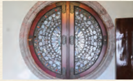
(例) 耕三寺潮聲閣の浴室の窓は珍しい丸形です。

洋館の窓は縦長で、現代建築は横長。時代によって木製・鉄製・アルミ製と材質が変わっていくのも面白いです。