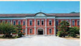
(例) 海上自衛隊第一術科学校は、レンガ造らしい重厚な壁が魅力的です。

木なら柱・梁の骨組みを組むのが基本、レンガなら壁をつくるのが基本など、素材によって建て方が違います。