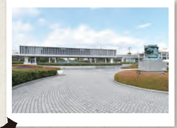
影の写りこみにも注意。同じ構図でも、少し日が陰ったタイミングの方が人や植木の影が消え、より建物が引き立った写真に。