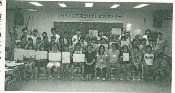
パイオニアスピリット実践セミナー風景

家庭教育支援については、「親の力」をまなびあう学習プログラムを開発し、プログラムを活用できる講師を養成し、講座