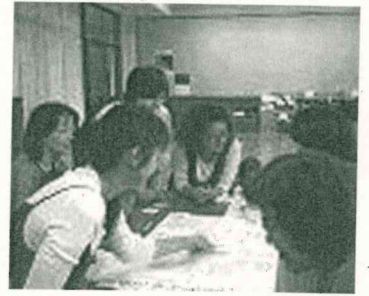
「親の力」をまなびあう学習プログラムと講座風景