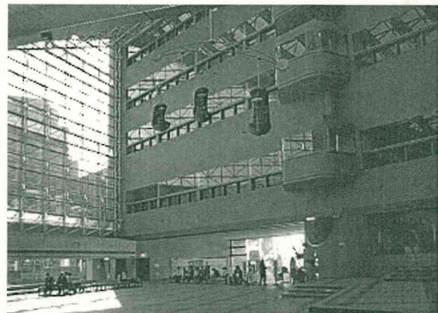
広島県情報プラザエントランスホール

毎年5月から6月にかけて県内全市町(23市町)を訪問し、テーマに基づく調査を行い、研究開発に生かしています(平成21年度テーマ①社会教育関係職員等の人材育成 ②家庭教育支援方策)。 市町の生涯学習振興・社会教育行政関係職員と直接会って調査することにより、調査・情報収集だけでなく、顔の見える関係ができ、市町の研修や事業の企画支援などにつながることも少なくありません。