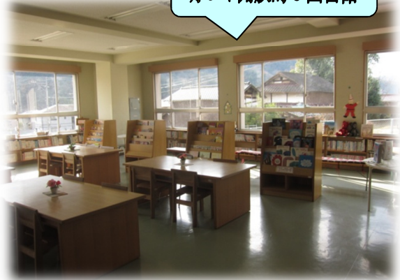
明るく開放的な図書館