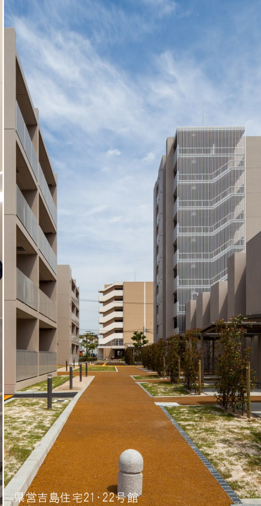
県営吉島住宅21・22号館