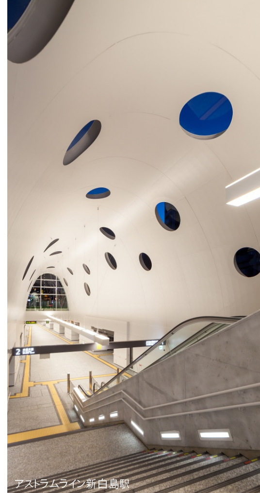
アストラムライン新白島駅