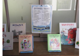
学年のおすすめの本

校内のさまざまな場所に読書コーナーがあるのも本校の自慢です。先生のおすすめの本や並行読書の本等を展示していつでも手にとれる環境を作っています。読書環境を整えることは児童の読書への意欲を高める大きな鍵です。