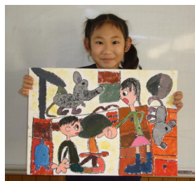
『ねずみを家に入れておこ られたリヴィングストーン』 「おうちに入れちゃだめ！」(ケ ヴィン・ルイス作)より

昨年度は、読書感想画で広島県読書感想画 優秀賞をいただき、うち1名は、全国コンク ールで奨励賞を受賞しました。今年も3作品 が優秀賞を受賞しています。