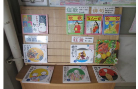
わたりろうかの読書コーナー

ことで読書への関心が高まり、来室者が増えました。本の種類や並べ方を示した分かりやすい案内も置いています。また、図鑑等の利用指導がしやすいように、指導パネルを常設し、活用しています。