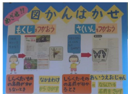
図鑑利用指導のパネル

ことで読書への関心が高まり、来室者が増えました。本の種類や並べ方を示した分かりやすい案内も置いています。また、図鑑等の利用指導がしやすいように、指導パネルを常設し、活用しています。