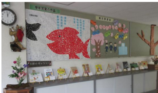
先生のおすすめの本の展示

2013年度（平成25年度）から蔵書の整理を行い、データベース化を行いました。併せて、誰もが行ってみたい図書館とするため、本が探しやすい配架や展示の工夫、環境整備を行いました。季節や月毎のテーマに沿った展示、新聞コーナーなどを作る