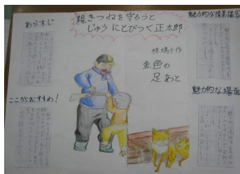
「金色の足あと」棕鳩十 作 5年生ショーウィンドウ

学習のねらいを達成す るために、並行読書に取 り組んでいます。教室に は常時、学習で使ってい る本が展示してあり、タ イムリーに活用できるよ うにしています。同じ作者や同じテーマで多読し、 自分で選書した本を使って学習を助け、深めてい きます。