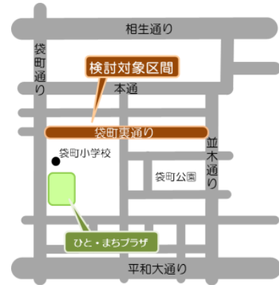
勉強会及び検討会の検討対象区間