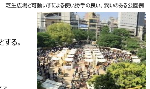
平成 27 年 5 月袋町公園で開催したトランクマーケット