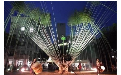
平成 27 年 11 月袋町公園で開催した大イノ祭り