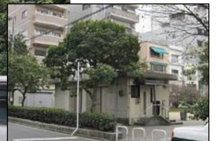
現況（袋町老人集会所）