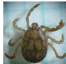
フタトゲチマダニ

マダニやツツガムシの活動が活発になる春から秋にかけて、マダニ等が媒介する感染症が多く発生しています。農作業やレジャーなどで、草むらや藪に入るときには、長袖、長ズボンの着用、忌避剤の使用等によりマダニ等に咬まれないよう注意しましょう。