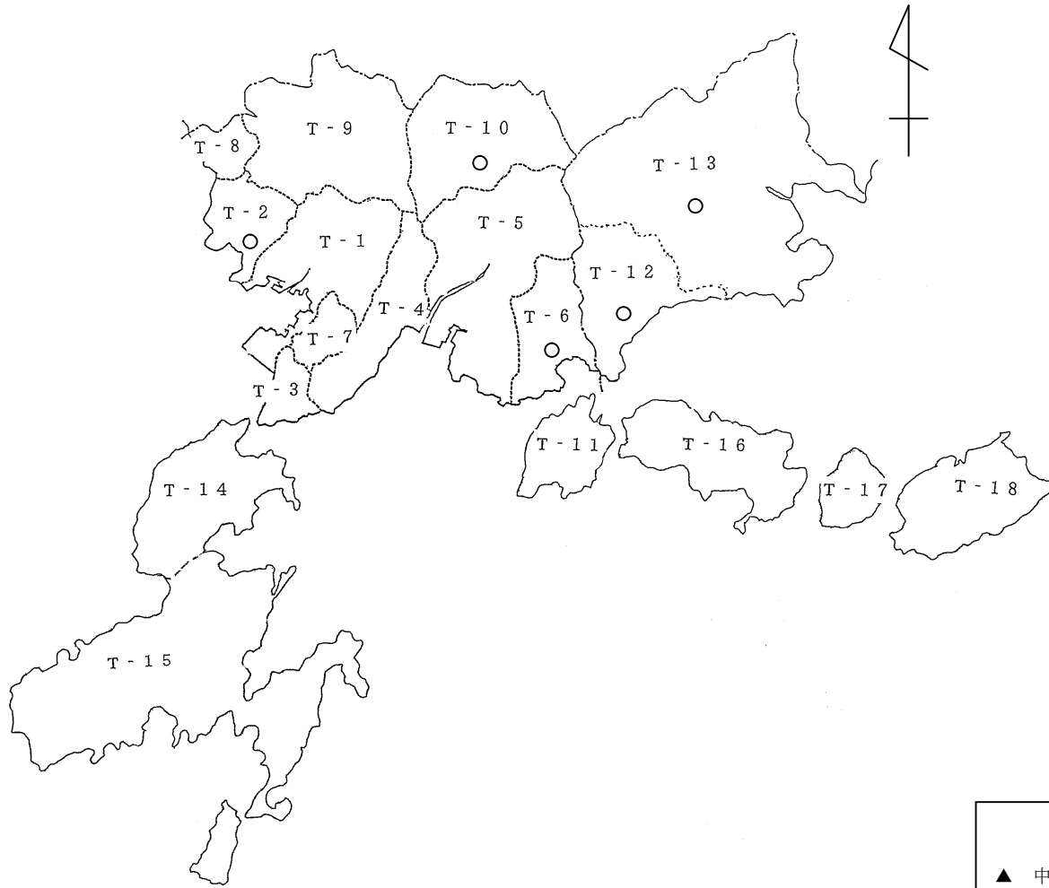
地下水調査測定点配置図 (4) (呉市の区域)