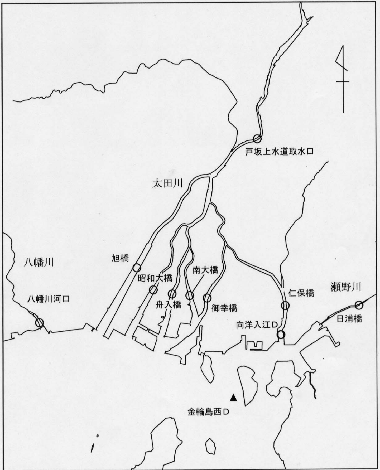
底質調査測定点配置図（1）