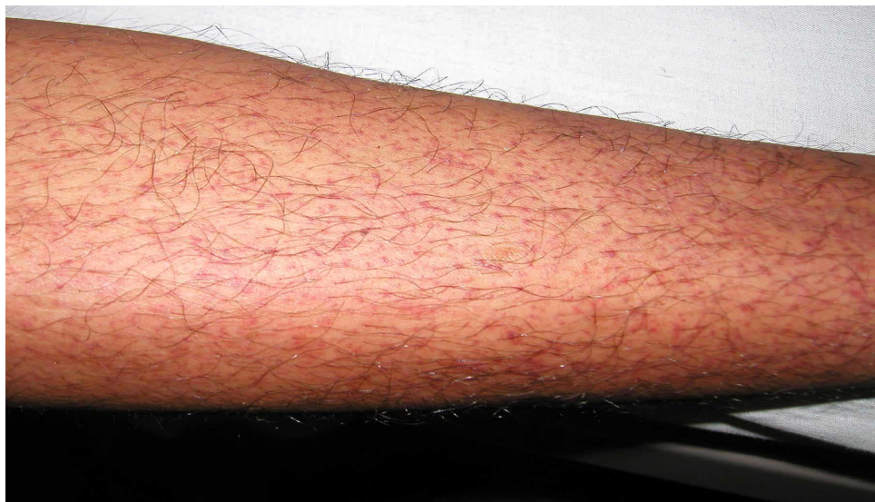
図 1. デング熱患者の発疹：解熱時期にみられた点状出血