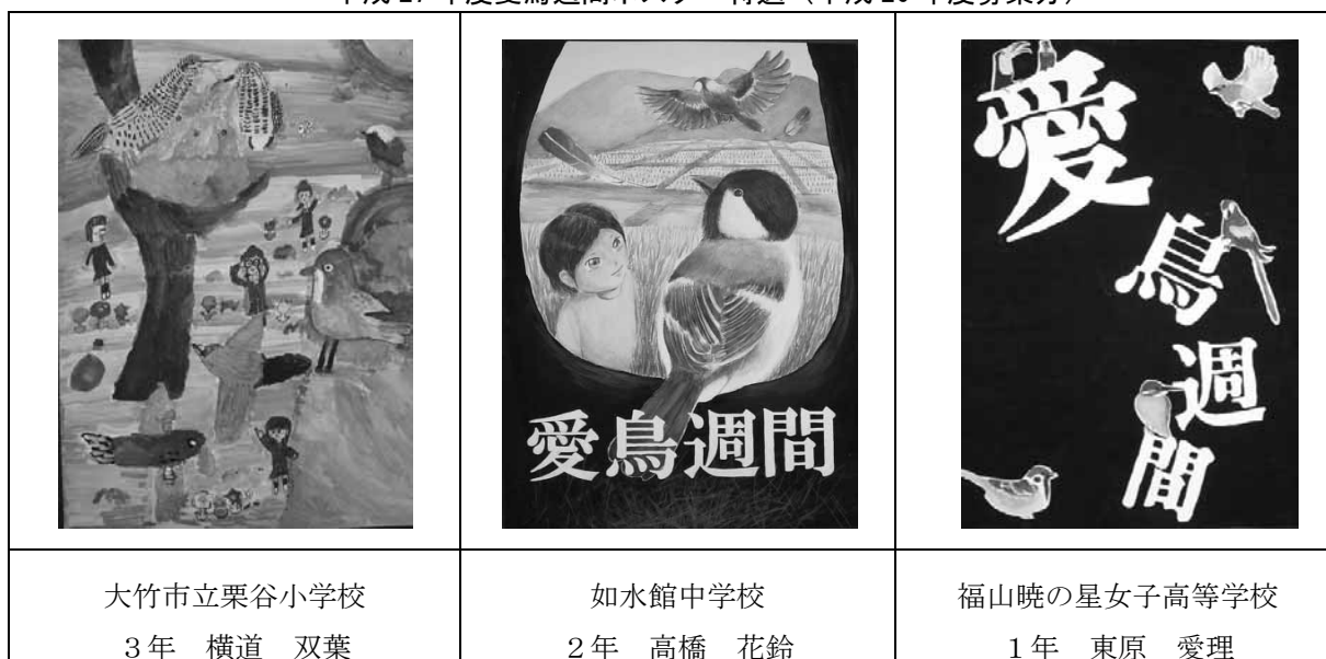
平成 27 年度愛鳥週間ポスター特選（平成 26 年度募集分）

【平成 27 年度実績・平成 28 年度内容】 ポスターを募集し、鳥獣保護の意識啓発を実施。