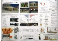
006 BEST-6 *3-M 4-T,M