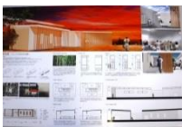
021 BEST-26 *4-T