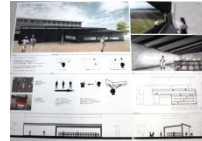
010 BEST-26 *4-N