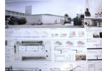
015 BEST-26 *4-F,M