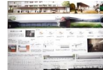
023 BEST-26 *4-N