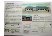
020 BEST-26 *4-T