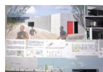
031 BEST-26 *4-M