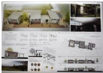
018 BEST-10 *3-T 4-I,F,T