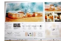
026 BEST-26 *4-T