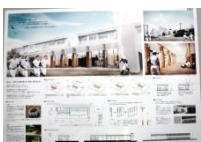
027 BEST-6 *3-I,N 4-I,N