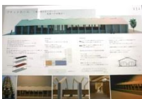
024 BEST-3 *1-F,T 2-I,F,N,T 3-I,F,N,M 4-F,N