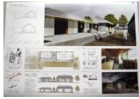
007 BEST-3 *2-F,N,T,M 3-I,F,N,T 4-I,N,T,M