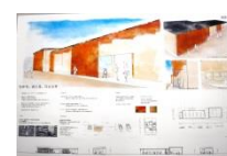
029 BEST-26 *4-T