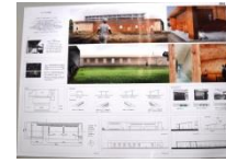
004 BEST-10 *3-F 4-F,N