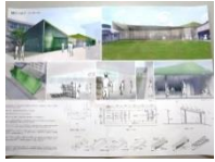
002 BEST-26 *4-N