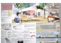
030 BEST-10 *3-T,M 4-I,F,T,M