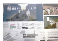
028 BEST-26 *4-N