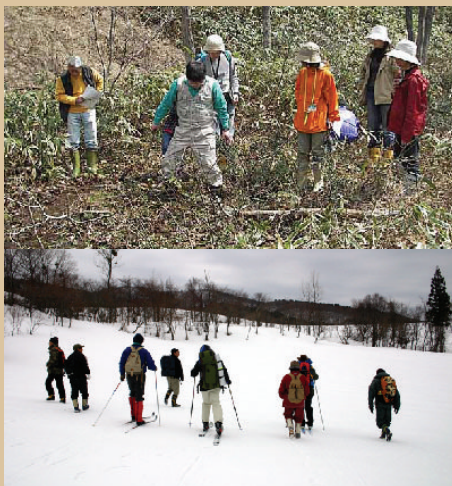
カスミサンショウウオの産卵調査 (西中国山地自然史研究会、開催：4月)