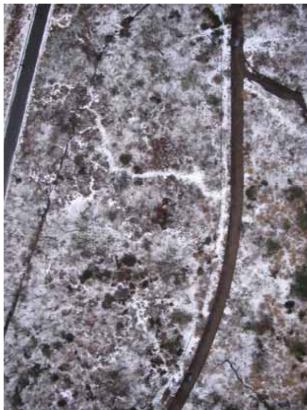
事業対象地空撮写真