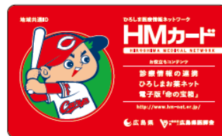
■キャンペーン中発行のカード