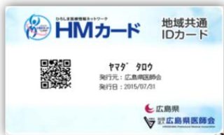
■通常時発行のカード