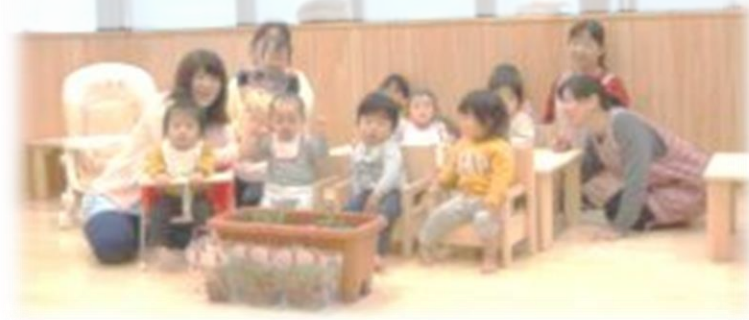
広島県・広島銀行事業所内保育施設「イクちゃんち」