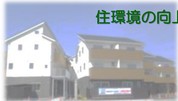
子育てスマイルマンション