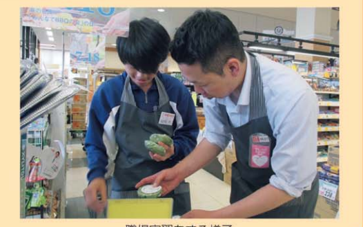
職場実習をする様子

職場見学や職場実習の受け入れなどのサポートや雇用等、生徒の働く力の育成や就労促進に著しい貢献をいただいた企業について、平成 28 年度から表彰を行っています。