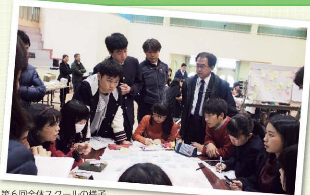
第 6 回全体スクールの様子

国公立の枠を超えて、県内の高校生たちが、他国の高校生や、企業、大学などと協働して広島の魅力と課題を発見して、広島を世界に発信する 3 か年のプロジェクト学習で、平成 27 年 7 月にスタートしました。平成 28 年 12 月末には第 6 回の全体スクールを行い、いよいよ、今年、最後のプロジェクトに取り組みます。